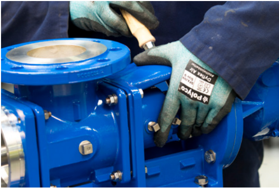
1. Entfernen Sie Stator und Rotor, um auf den Antrieb zuzugreifen

Die PC Transferpumpe – Komfort ist die neueste Pumpenkonstruktion mit innovativen Statorclammern, die Zugstangen überflüssig machen. Zur Minimierung von Zeit und Kosten, die bei der Wartung einer Prozesspumpe entstehen, können PC Transferpumpen – Komfort an Ort und Stelle ohne Demontage des Rohrleitungssystems gewartet werden. Die komplette Antriebseinheit inkl. Rotor, Stator, Gehäuse und Dichtung kann binnen Minuten abgebaut werden.