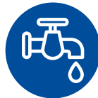
Wasser und Abwasser