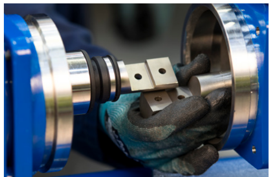
6. Lösen Sie den Hydraulikrotor von der Antriebswelle