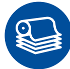
Papier und Zellstoff