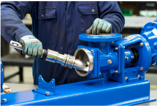
3. Entfernen Sie die Antriebswelle