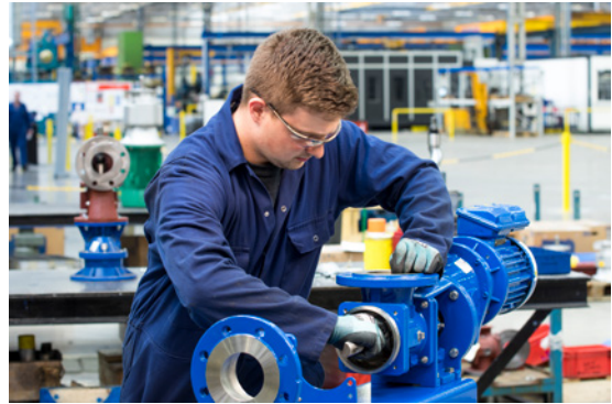
2. Spritzringschutz zurückziehen und Stift herausdrücken