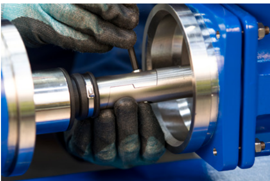
5. Die geteilte Kupplung wird mit Schrauben zusammengehalten

Die geteilte Kupplung mit positivem Drehmoment ist eine Kupplung mit glattem Profil, die für die Wartung an Ort und Stelle sowie für die Montage/Demontage der Klemmkomponenten ausgelegt ist.