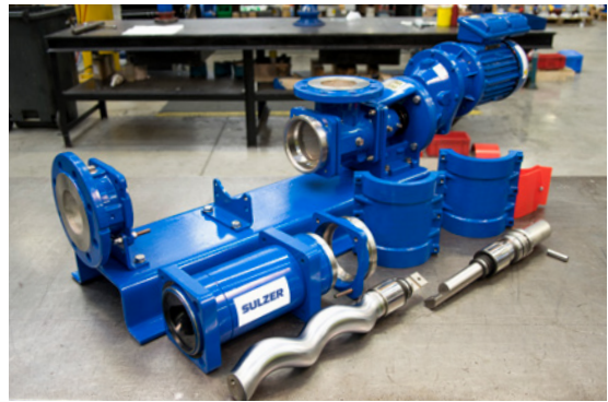
4. Alle Verschleißteile sind leicht zu entfernen